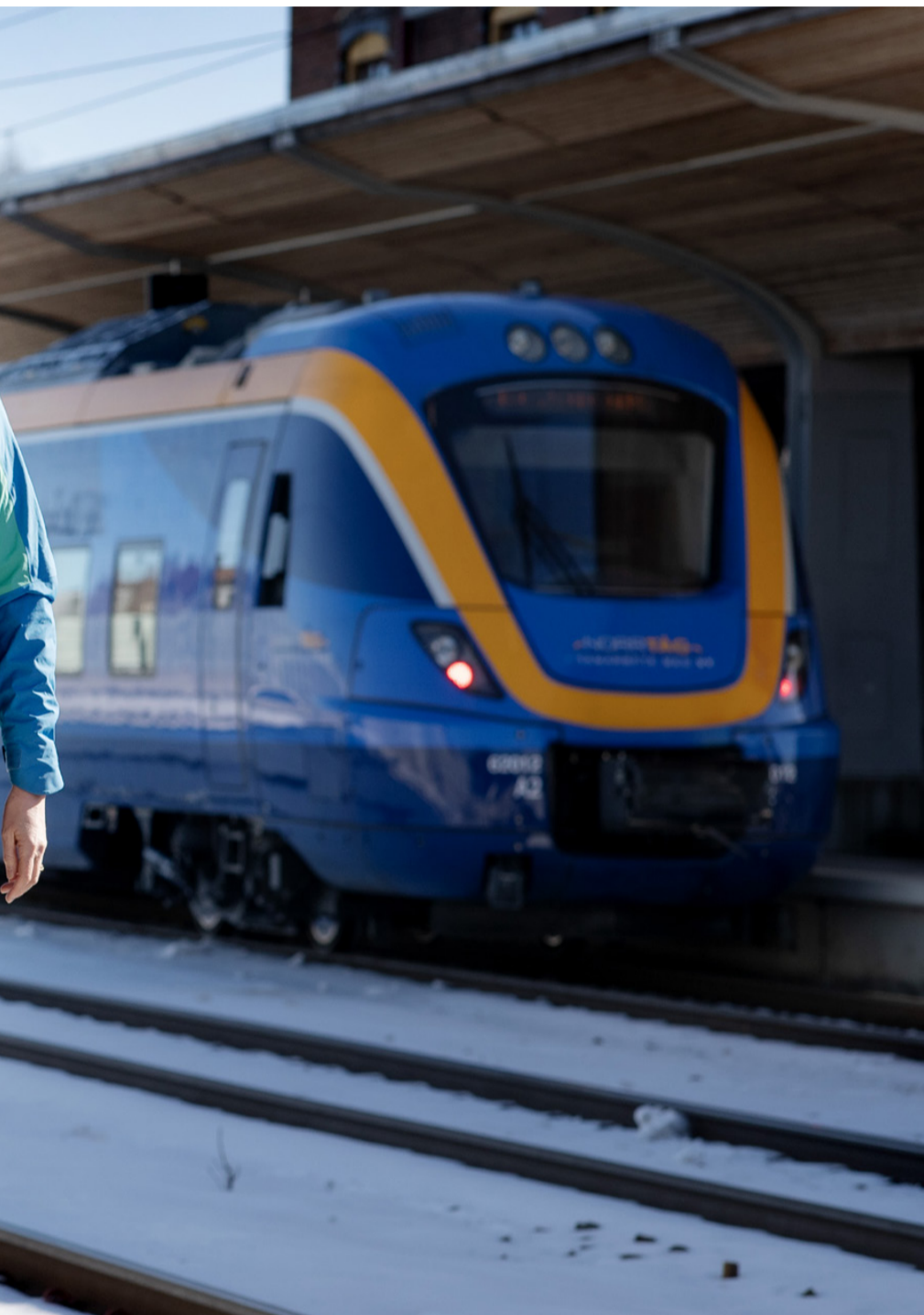
tredje luff och har bra tips och erfarenheter som gör resan enklare.